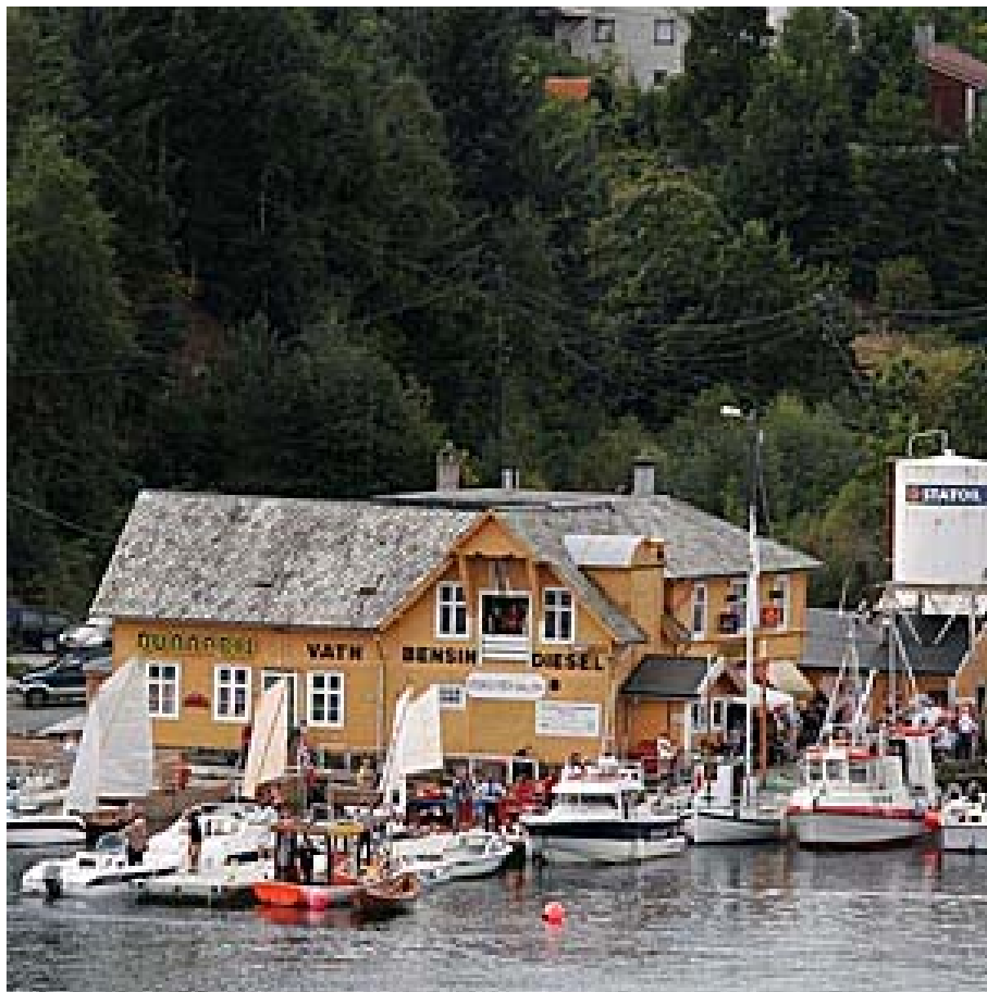
Oselvere ved kai utenfor Øyane Handel, Vedholmen, klare til kappseilas i 2006.