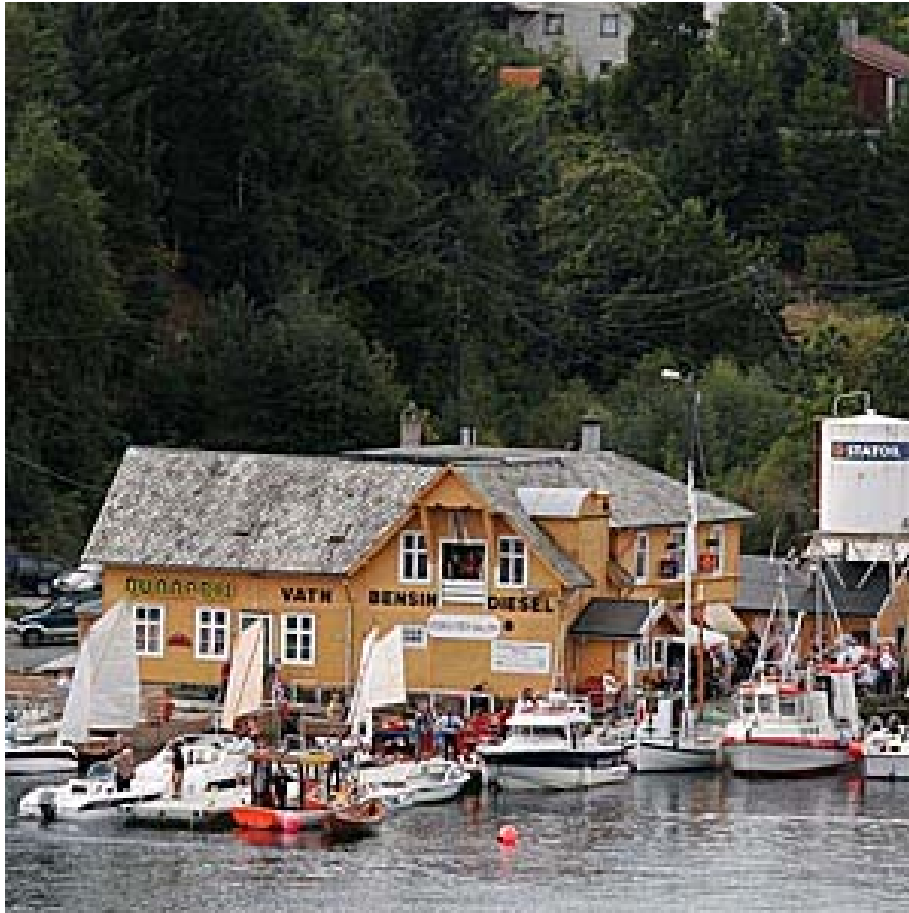
Oselvere ved kai utenfor Øyane Handel, Vedholmen, klare til kappseilas i 2006.