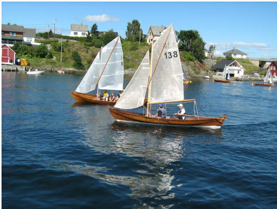
Oselverne venter på start ved Veholmen i 2008.